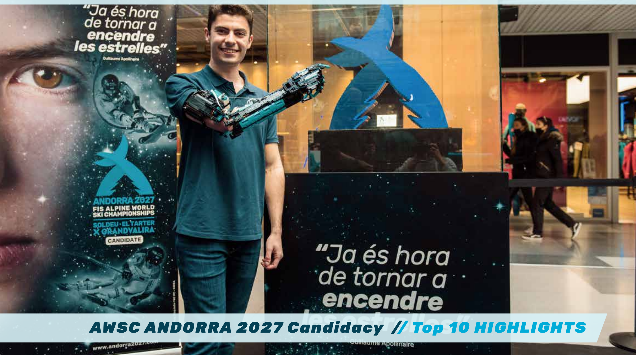
AWSC ANDORRA 2027 Candidacy // Top 10 HIGHLIGHTS

ACCESSIBILITAT Uns Mundials per a tothom, per a que ningú se'n quedi exclòs