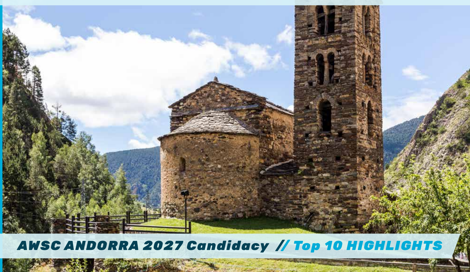
AWSC ANDORRA 2027 Candidacy // Top 10 HIGHLIGHTS